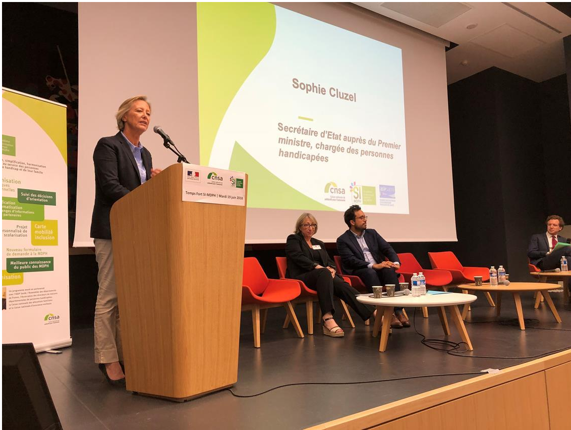
Sophie Cluzel (secrétaire d'Etat auprès du Premier ministre, chargée des personnes handicapées), Marie-Anne Montchamp (présidente du Conseil de la CNSA) et Mounir Mahjoubi (secrétaire d'Etat auprès du Premier ministre, chargé du numérique) - Temps fort SI MDPH, 19 juin