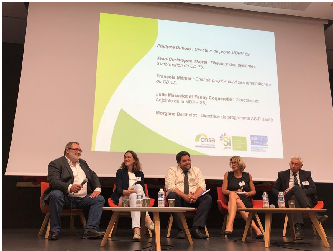
Table ronde « SI-MDPH, une réalité pour tous »

Enfin, Mounir Mahjoubi, Secrétaire d'Etat auprès du Premier ministre, chargé du numérique a rappelé l'importance de ce SI harmonisé qui « vise à simplifier la vie des agents et des usagers. Il a tenu à féliciter les premiers départements « explorateurs ».